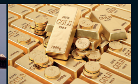
Goldbarren und Münzen